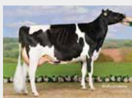
Grazie VG-86 2. LA