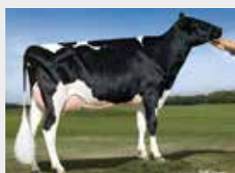
Dam: Fly-Higher Bookem Mace