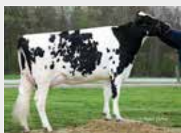
Granddam: Hendel Shottle Mica 2144

DEU 000948526903 German Reg. No. 10.832860